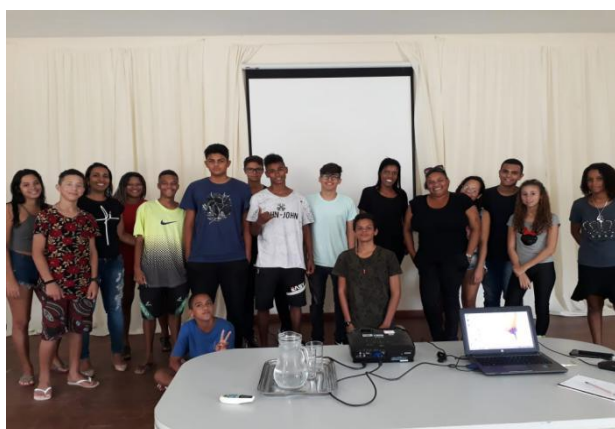
Palestra sobre a Profissão e a Importância do Meio Ambiente - Gerente de Meio Ambiente