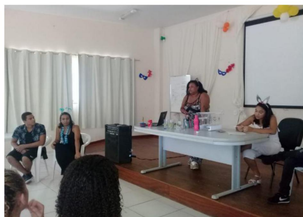
Prevenção e Segurança no Carnaval